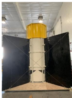
図 1: 波力エネルギー変換器。

現在ハワイ大学では、図1に示されている波力エネルギー変換器が製作されています。既にほとんどの作業が完了しており、9月の半ばには海での実証実験が計画されています。この波力エネルギー変換器の原理としては、波が下図に示されている円筒型の容器に入っていくことにより、容器の中で水面が上下し、それによって空気の振動が起こるというものです。つまり、この変換器は波のエネルギーを空気の運動エネルギーに変換します。その空気の運動エネルギーは、変換器に取り付けられる予定の空気タービンによって、電気エネルギーへと変換されます。